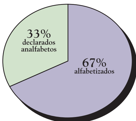
Figura 1. Medición tradicional del alfabetismo

con las tasas más bajas de alfabetismo. El programa LAMP proporcionará los datos básicos sobre los cuales se podrán construir los planes de ejecución de la iniciativa LIFE y programas de alfabetización para adultos.